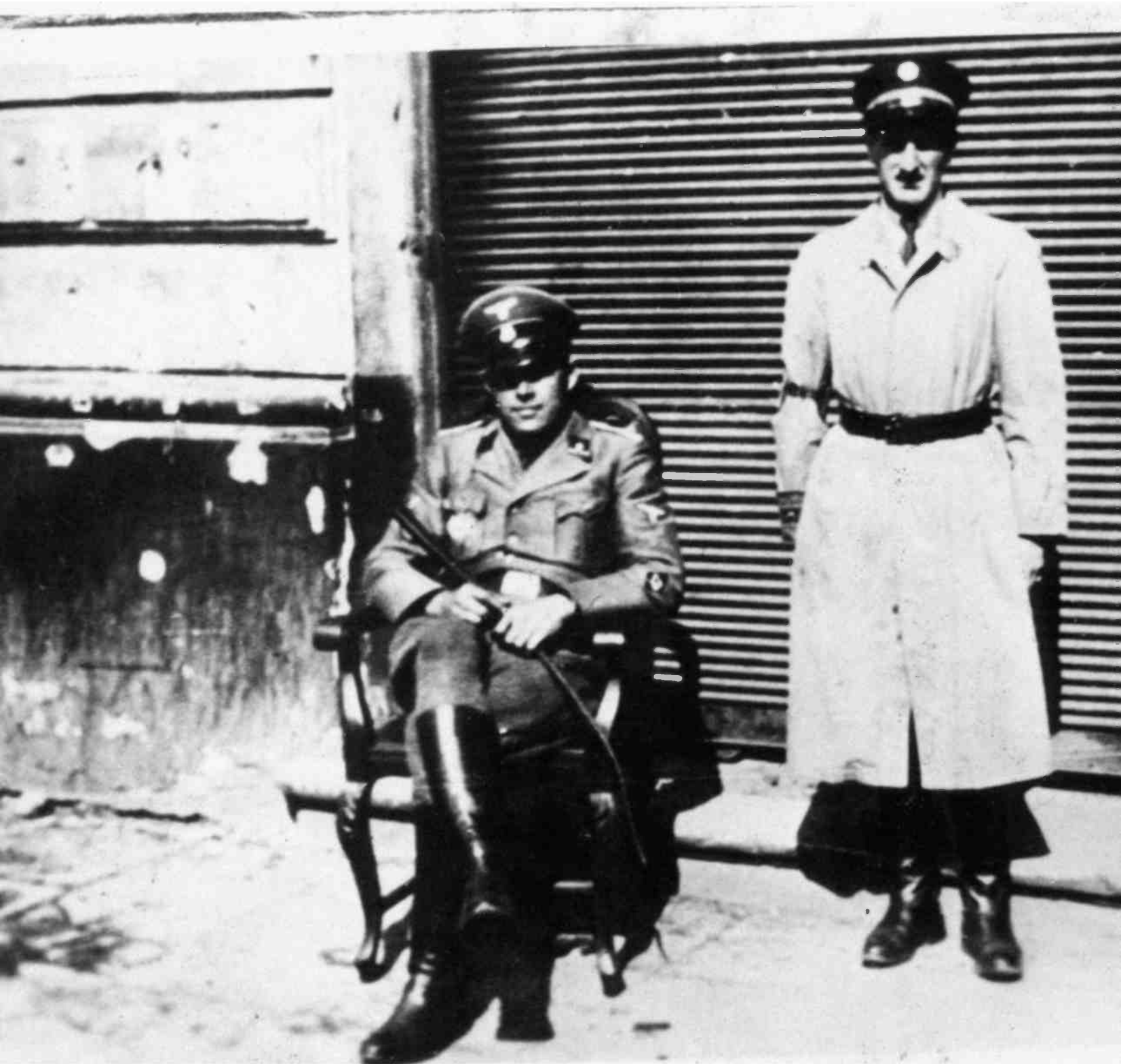
שוטר יהודי עומד ליד חייל נאצי בגטו ורשה, 1942. קשה להבחין בין הקורבן למקרבן